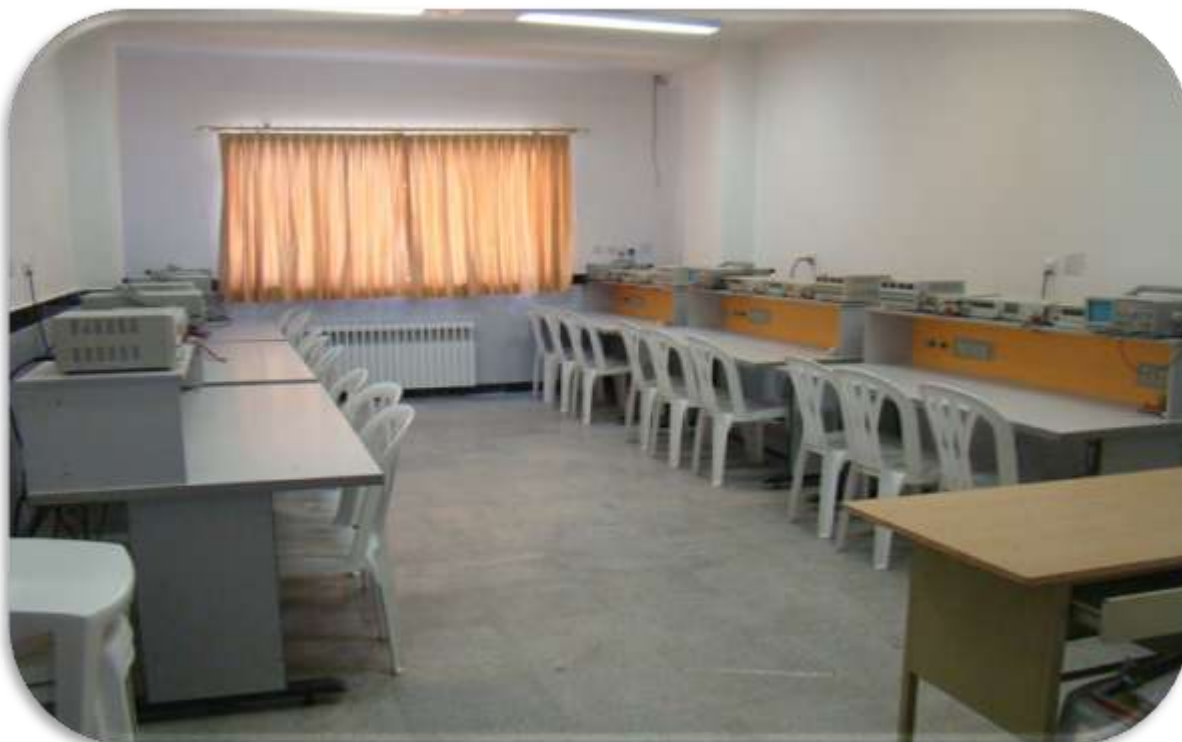
نمونه ای از آزمایشگاه های مؤسسه (آزمایشگاه اصول اندازه گیری الکترونیکی و مدار)