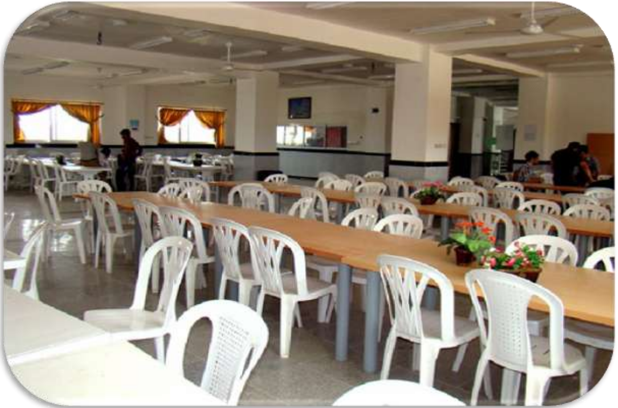
سالن غذاخوری (سلف سرویس)

آدرس : ساری - بلوار فرع آباد - کیلومتر ۵ - کد پستی: ۱۳۹۱۹ - ۴۸۱۶۱