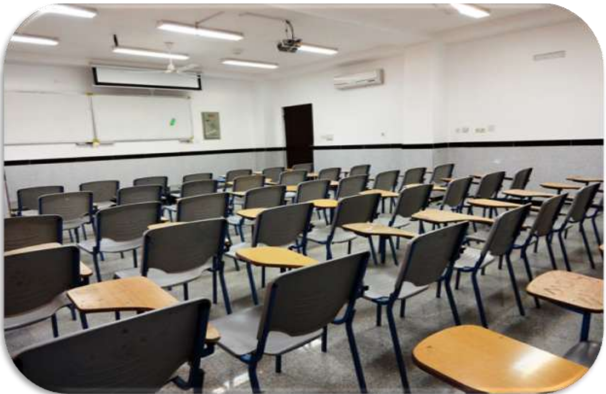
نمونه ای از کلاس های درس مؤسسه

آدرس : ساری - بلوار فرح آباد - کیلومتر ۵ - کد پستی: ۱۳۹۱۹ - ۴۸۱۶۱