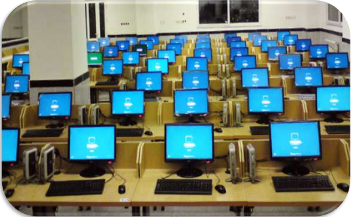
سایت (۱) مؤسسه