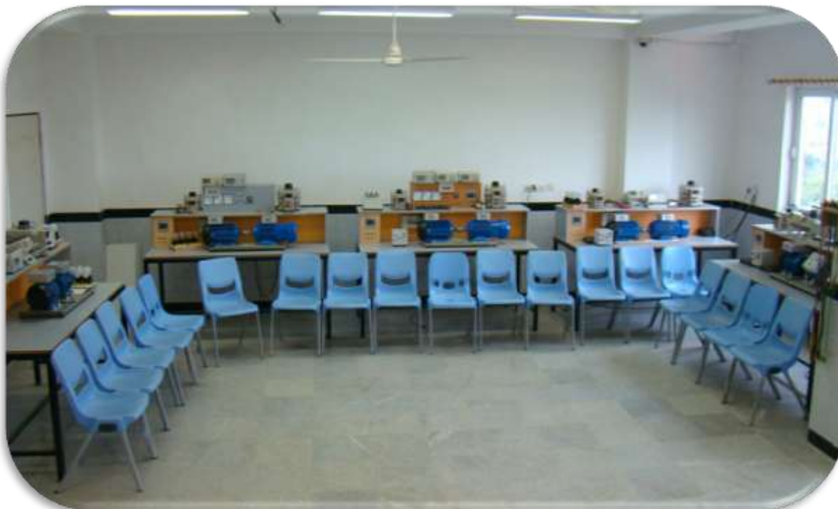
نمونه ای از آزمایشگاه های مؤسسه (آزمایشگاه ماشین های الکتریکی)