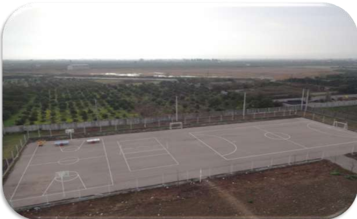
زمین چند منظوره ورزشی

آدرس : ساری - بلوار فرع آباد - کیلومتر ۵ - کد پستی: ۱۳۹۱۹ - ۴۸۱۶۱