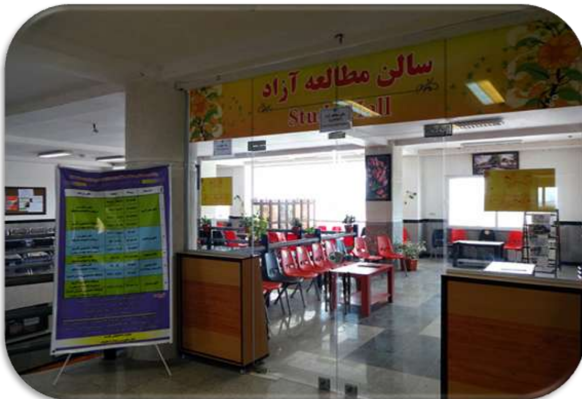
سالن مطالعه خواهران