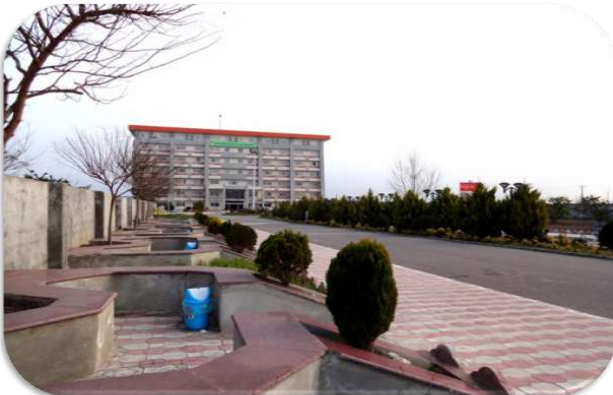
مسیر ورودی پردیس مؤسسه

مؤسسه آموزش عالی هدف غیر دولتی غیر انتفاعی