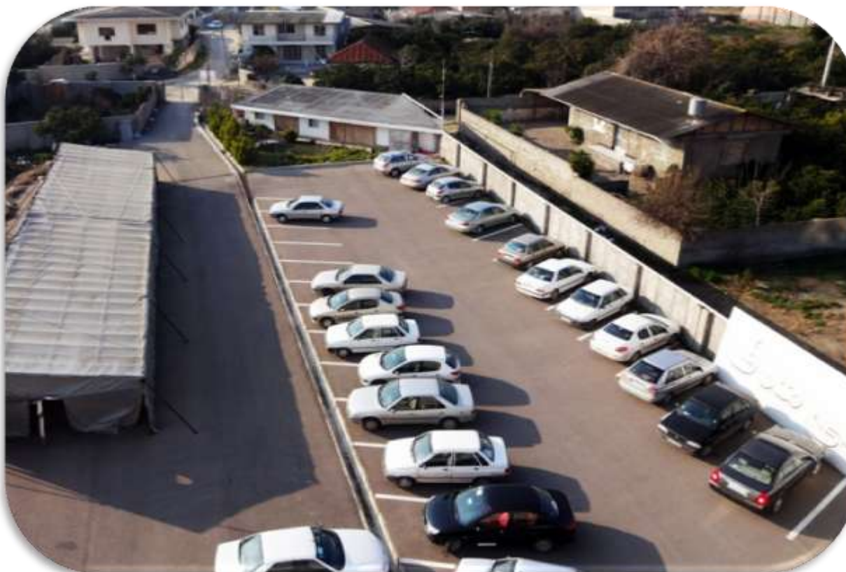
پارکینگ اساتید و کارکنان مؤسسه

آدرس : ساری - بلوار فرح آباد - کیلومتر ۵ - کد پستی: ۱۳۹۱۹ - ۴۸۱۶۱