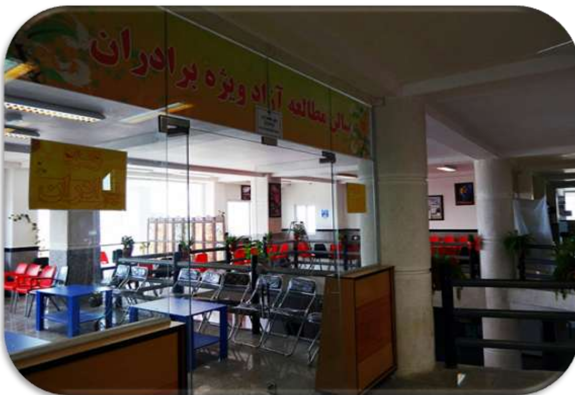
سالن مطالعه برادران

آدرس : ساری - بلوار فرع آباد - کیلومتره - کد پستی: ۱۳۹۱۹ - ۴۸۱۶۱